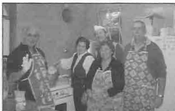
"El equipo de cocina que preparó la pasta para el almuerzo congregacional del domingo del 30 de abril."