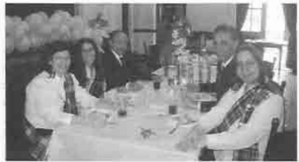
El Coro "Farum"