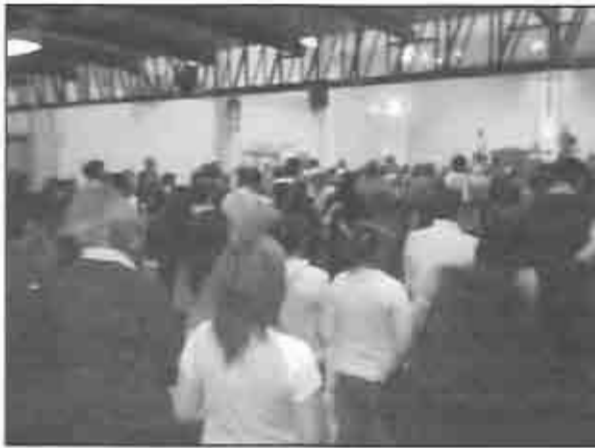
Conferencia de Líderes