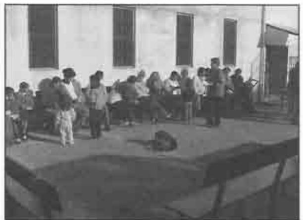
Gente esperando en Ferrari. Más de quinientas personas atendidas.