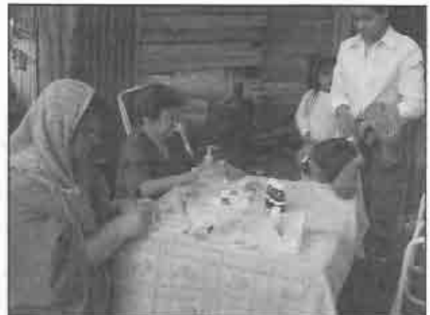
Doctores de piel