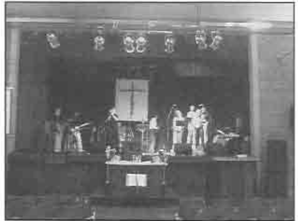
Fotos tomadas durante el culto del domingo de Pascua cuando el Equipo de Adoración estuvo a cargo de la alabanza.