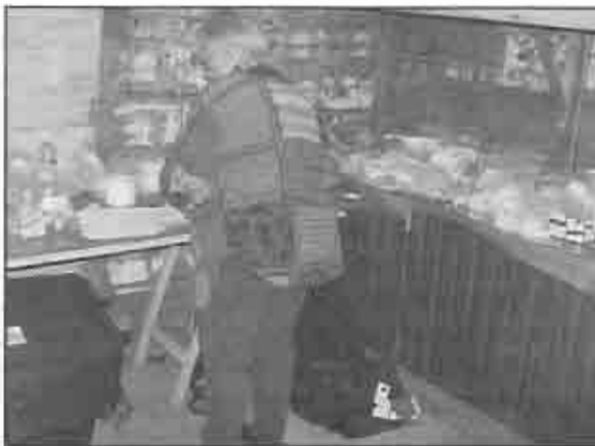
Farmación (Farmacia - Misión) "La Misión" en el merendero.