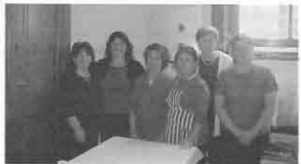
La muy eficiente equipo de anfitrionas